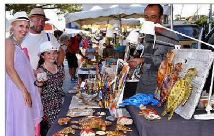
Des produits traditionnels à découvrir chaque jeudi sur le marché de Miramar, ainsi que sur les nombreux marchés organisés en soirée.