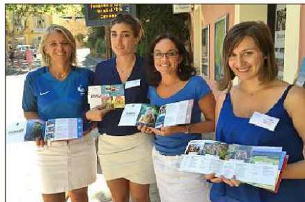
Les conseillères en séjour de l'office de tourisme présentent le guide « Amusez-vous ».

programme de la semaine en feuilletant la brochure et en bénéficiant de substantielles économies! C'est le cas pour les entrées de la plage du Pellegri, du jardin zoologique de la Londe ou pour faire une traversée vers les îles d'or. Alors pour profiter de loisirs à petits prix, rendez-vous dans les bureaux des offices du village et de la Favière, ouverts tous les jours. B. K.