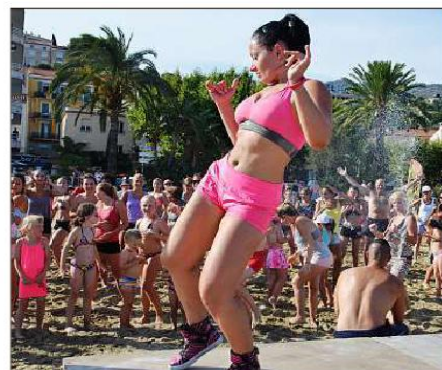
Chaque lundi et jeudi à 18 h, les amateurs de danse sont attendus nombreux pour la zumba de l'été.

Gratuit et ouvert à tous. Renseignements : 04.94.00.40.50 ou 04.94.00.41.71